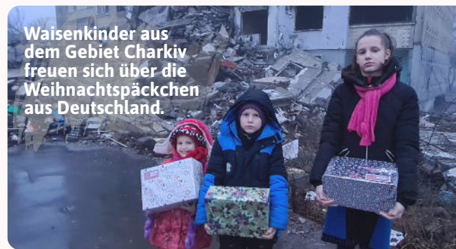
Waisenkinder aus dem Gebiet Charkiv freuen sich über die Weihnachtspäckchen aus Deutschland.

"Gebt, was ihr habt, dann werdet ihr so überreich beschenkt werden, dass ihr gar nicht alles aufnehmen könnt. Mit dem Maßstab, den ihr an andere anlegt, wird man euch messen." (Bibel: Lukas 6,38)