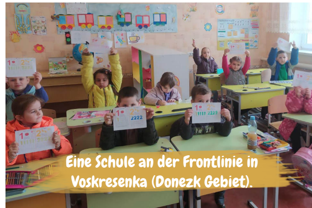
Eine Schule an der Frontlinie in Voskresenka (Donezk Gebiet).